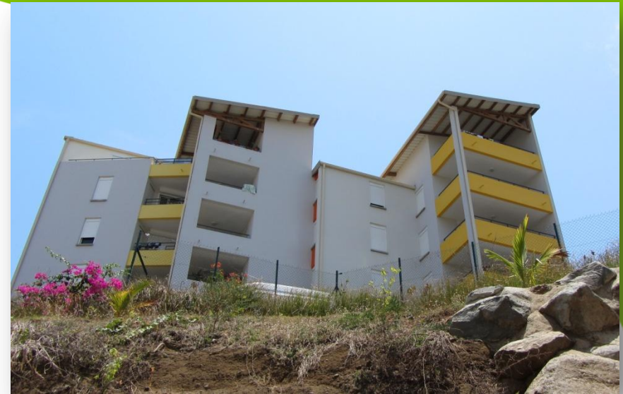
Portes du lagon – LLS- Mamoudzou